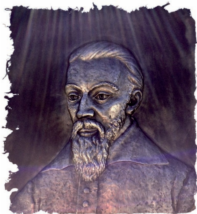
10 Commémoration du 500 ème anniversaire de Sébastien Castellion le 13 juin 2015.

Il y a deux ans nous nous sommes lancés dans ce beau projet. Nous avons certainement eu un peu d'inconscience vis-à-vis du travail qu'il nécessiterait, mais nous avons eu surtout de la volonté et du courage. Volonté de donner à cette fête l'importance et la qualité que méritait ce grand homme.