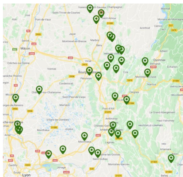
Nids de frelon asiatique détruits sur le département de l'Ain en 2019

Les conditions climatiques de l'année semblent avoir été défavorables au prédateur. Malgré tout, le frelon asiatique continue sa progression.