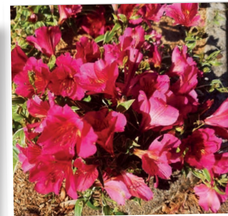
Alstromeria Valley River