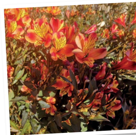
Alstromeria Indiana Summer