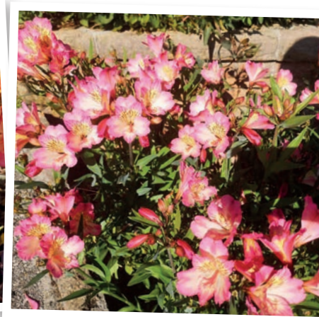
Alstromeria Valley Time