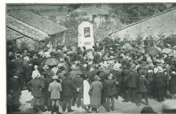
M. Ferdinand Buisson, prononçant son discours.