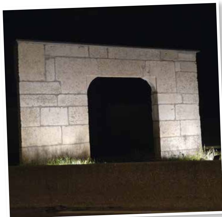
Éclairage de l'arche en pierre à l'entrée du village.

Vous avez sans doute remarqué que l'éclairage de l'arche en pierre à l'entrée du village a été réalisé.