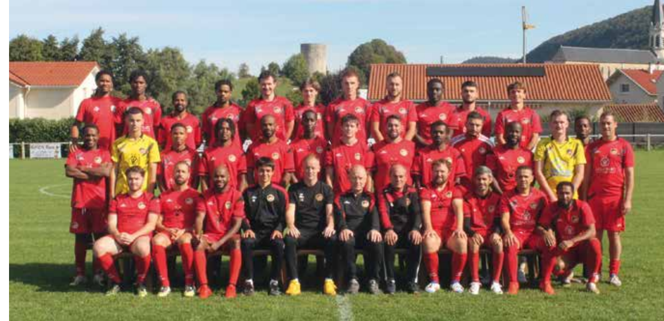
Photo officielle de nos seniors évoluant en D3 et D5