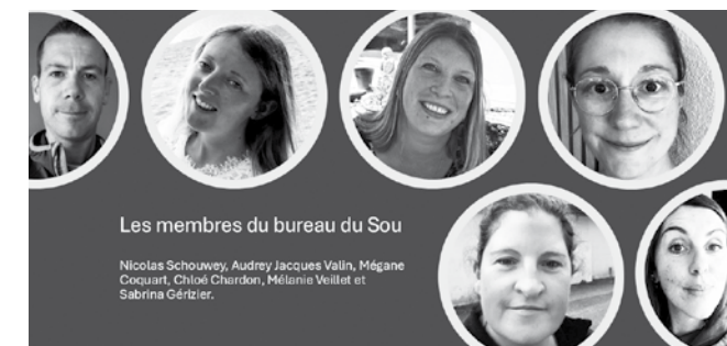
Les membres du bureau du Sou

A très bientôt pour cette nouvelle année pleine de projets ! ■